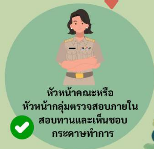
หัวหน้าคณะหรือ หัวหน้ากลุ่มตรวจสอบภายใน สอบทานและเห็นชอบ กระดาษทำการ

11. หากหัวหน้าคณะหรือหัวหน้ากลุ่มตรวจสอบภายในสอบทานและเห็นชอบกระดาษทำการแล้ว ให้ผู้ตรวจสอบภายในนำข้อมูลจากกระดาษทำการสรุปผลการตรวจสอบมาจัดทำร่างรายงานผลการตรวจสอบ เสนอหัวหน้ากลุ่มตรวจสอบภายใน