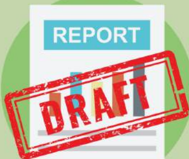
จัดทำร่างรายงานผลการตรวจสอบ เสนอหัวหน้ากลุ่มตรวจสอบภายใน